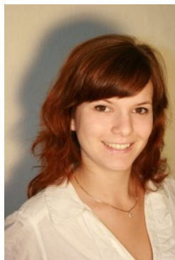
Von Martina Hamester, Kreisvorsitzende