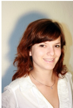
Von Martina Hamester, Kreisvorsitzende